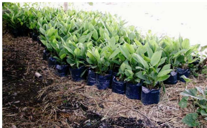
Figura 5. Plantas tropicales cultivadas en paja gastada envejecida