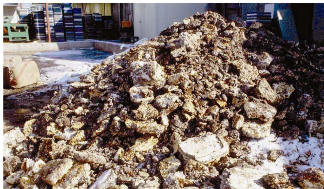
Figura 2. Sustrato gastado de aserrín proveniente de cultivo en bolsas

Por ejemplo, un productor de hongos tailandés recicla su sustrato gastado usándolo como tierra para otras plantas (Fig. 4, 5). El sustrato gastado fue puesto a la intemperie durante más de un año antes de su reutilización.