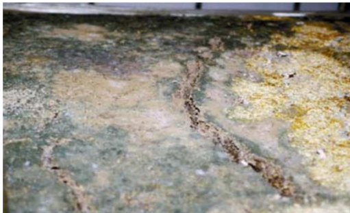
Figura 1. Cama de hongos contaminada por moho verde