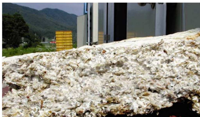
Figura 3. Sustrato gastado de residuos del aladón de cultivo en estantes