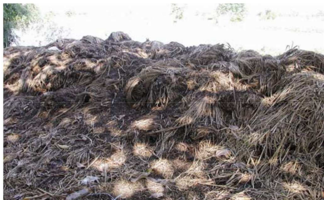
Figura 4. Sustrato gastado de paja durante el envejecimiento antes de ser reutilizado